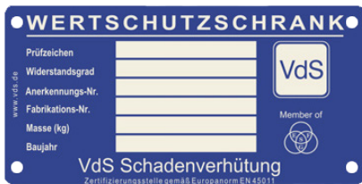
Beispiel Typenschild VdS-Tresore

Sehr geehrter Kunde, bitte bewahren Sie dieses PDF sorgfältig auf. Serienmäßig erhalten Sie mit Ihrem Tresor zwei Doppelschlüssel. Für Ersatz- oder Nachbestellungen verwenden Sie bitte dieses Formular. Bei Tresormodellen mit den hier abgebildeten Typenschildern können aus Sicherheitsgründen Ersatzschlüssel nur nach Vorlage eines Originalschlüssels angefertigt werden. Diese Vorschriften wurden zu Ihrer Sicherheit vom Verband der Schadenversicherer VdS in Köln herausgegeben.