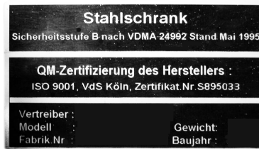
Beispiel Typenschild VDMA-Tresore